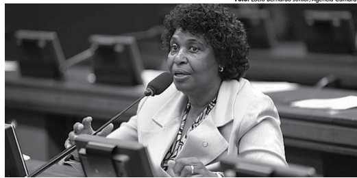
Deputada federal Benedita da Silva critica fala de Bolsonaro "Bolsonaro, denunciamos como animais"