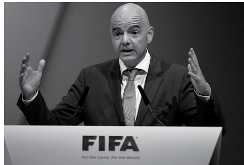
Gianni Infantino espera uma recuperação financeira da entidade no próximo ano, mas a Fifa

O anúncio, feito nesta semana, de que a estatal chinesa de eletrônicos Hisense vai patrocinar a Copa do Mundo de 2018 reforçou a convicção entre dirigentes de que o gigante asiático vai se candidatar. O termo usado por quem toma decisões na Fifa é "inevitável". Esta não é a primeira empresa chinesa a despejar dinheiro na Fifa. O grupo Wanda assinou no ano passado um contrato de patrocínio até 2030, no valor de US$ 900 milhões. O investimento em futebol local também é bastante alto.