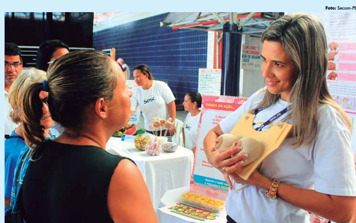
Ação da SES e do Sesc com serviços para a população, com foco na prevenção e promoção da saúde, visando uma melhor qualidade de vida.

“A distímia ou depressão leve é uma doença silenciosa. Hoje, entretanto, 6% da população mundial são acometidos por esse quadro. O indivíduo sofre calado e é comumente caracterizado como uma pessoa rabugenta ou mal-humorada. Atualmente, sabe-se que não se trata só de uma característica de humor ou temperamento. A pessoa está sempre triste, tudo é ruim, nada está bom. É alguém que não sente prazer ao realizar suas atividades rotineiras, mas consegue conviver, não se prostra”, explicou.