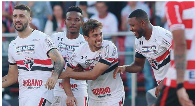
No primeiro jogo, também disputado no Estádio do Morumbi, o São Paulo não conseguiu evitar o Linense pelo placar de 2 a 0