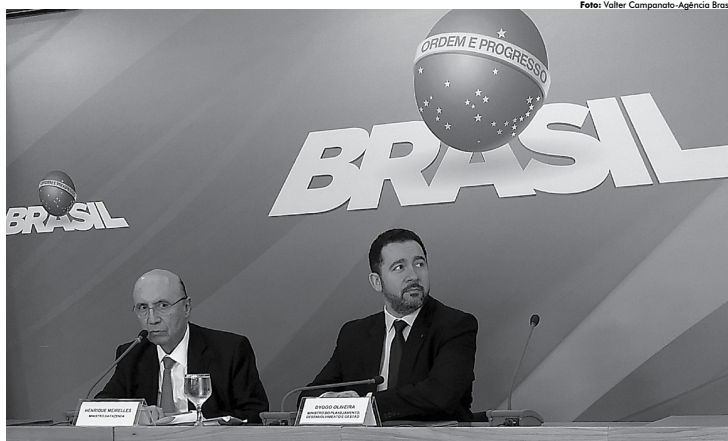
Ministros da Fazenda, Henrique Meirelles, e do Planejamento, Dyogo Oliveira, apresentaram ontem o projeto da LDO de 2018

Como em 2016 houve contração de 3,6% do PIB, o salário mínimo será corrigido exclusivamente pela variação do IPCA de 2017. Para chegar a estimativa, o governo considerou a estimativa de 4,48% para o IPCA que consta do boletim Focus, pesquisa com mais de 100 instituições financeiras divulgada toda semana pelo Banco Central.